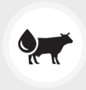
Grasas animales cat 1 & 2